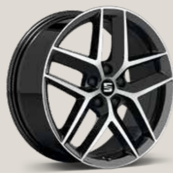
Performance 30/2 Machinaal bewerkt FR