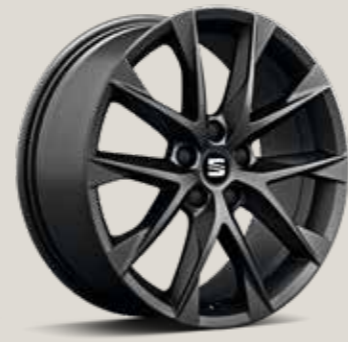
Performance Black FR