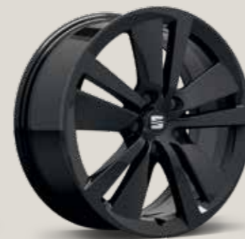
Black St FR