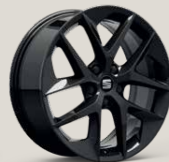
Black St FR