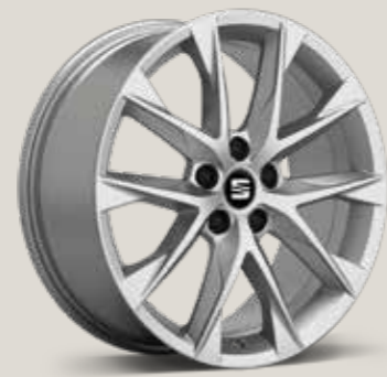
Performance 30/1 FR