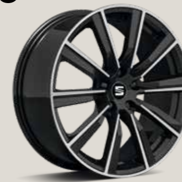
CupRacer Black FR CU