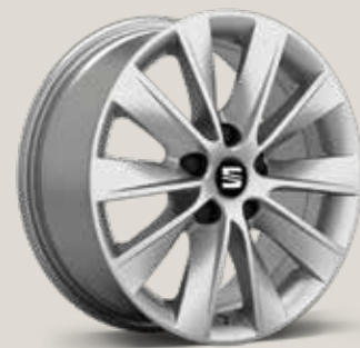
Design 30/2 ST