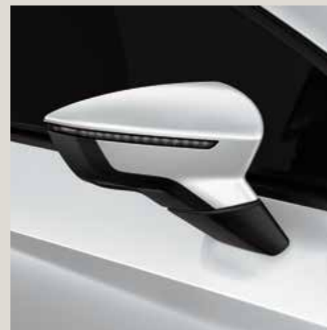
Nevada White 2 St FR CU