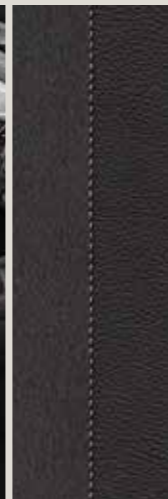
Sportzetels Dinamica zwart CE + WL3