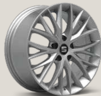
Dynamic 30/3 ST