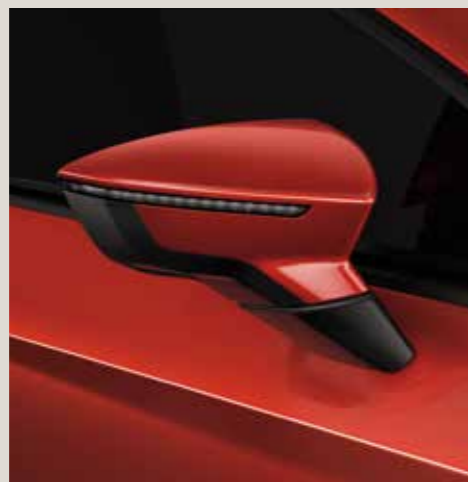
Pure Red St FR CU