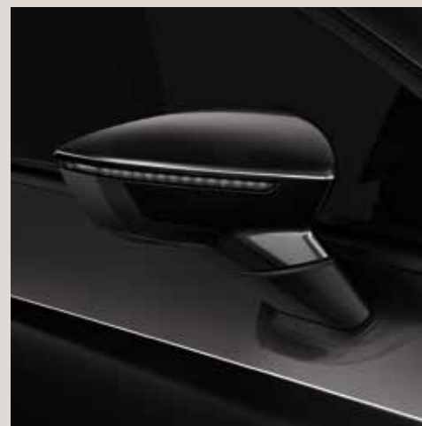
Midnight Black 2 St FR CU