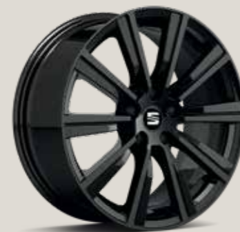
CupRacer Black St FR