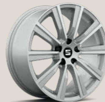
CupRacer Grey St FR