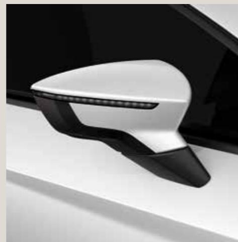
White 1 St

Move Ultimate St FR Limited Edition FR CUPRA CU Standaard ■ Optioneel ■