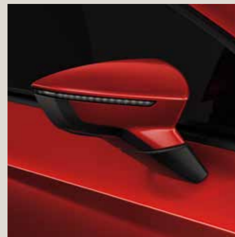
Desire Red 2 St FR CU