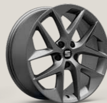
Titanium Grey St FR