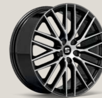
Black Performance FR CU

Move Ultimate St FR Limited Edition FR CUPRA CU Standard ■ Optional ■