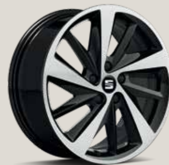
Black Machined St FR