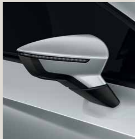
Dynamic Grey* 2 FR