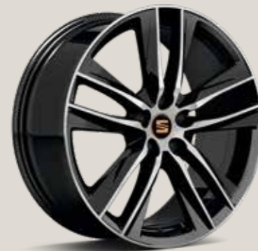
CUPRA 30/2 Black High Gloss CU

Move Ultimate ST FR Limited Edition FR CUPRA CU Standaard ST Optioneel OP