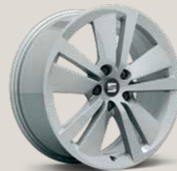
Dynamic Grey St FR