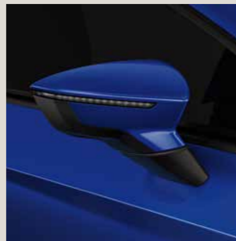
Mystery Blue 2 St FR CU