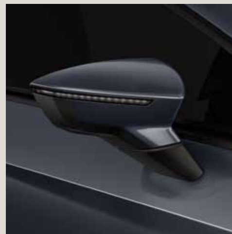
Magnetic Tech 2 St FR CU