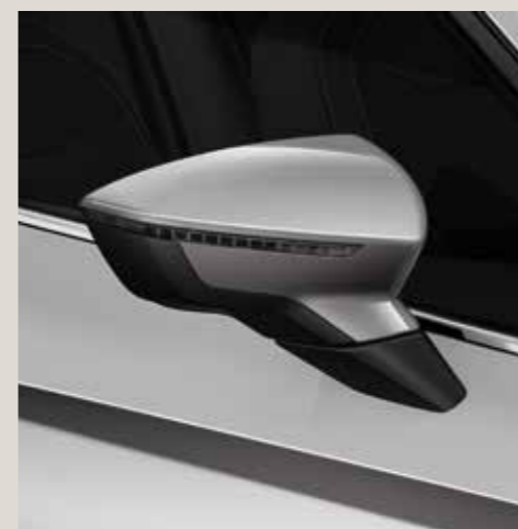
Gris Urbain St FR CU